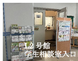
L2 号館 学生相談室入口