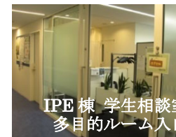
IPE 棟 学生相談室 多目的ルーム入口